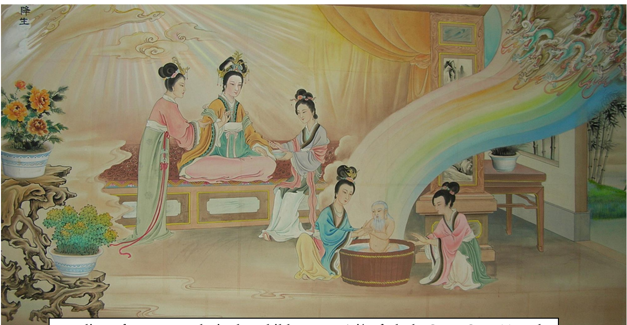
Detaljer af et vægmaleri, der skildrer Lao Zi's fødsel. Gray Goat Temple, Chengdu, Sichuan, Kina.