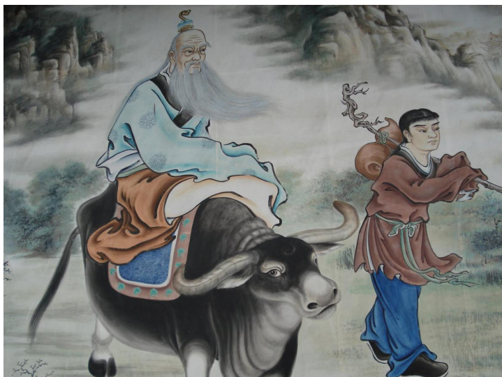
Lao Zi ved Hangu passet

På et tidspunkt i historien hvor videnskaben endnu var i sin vorden, brød Lao Zi intuitivt gennem alle erkendelsens barrierer og nåede en filosofisk kerne ligesom en pil når sit mål. Ifølge Lao Zi’s opfattelse er ”Dao” naturens lov, i overensstemmelse med kvantefysikkens