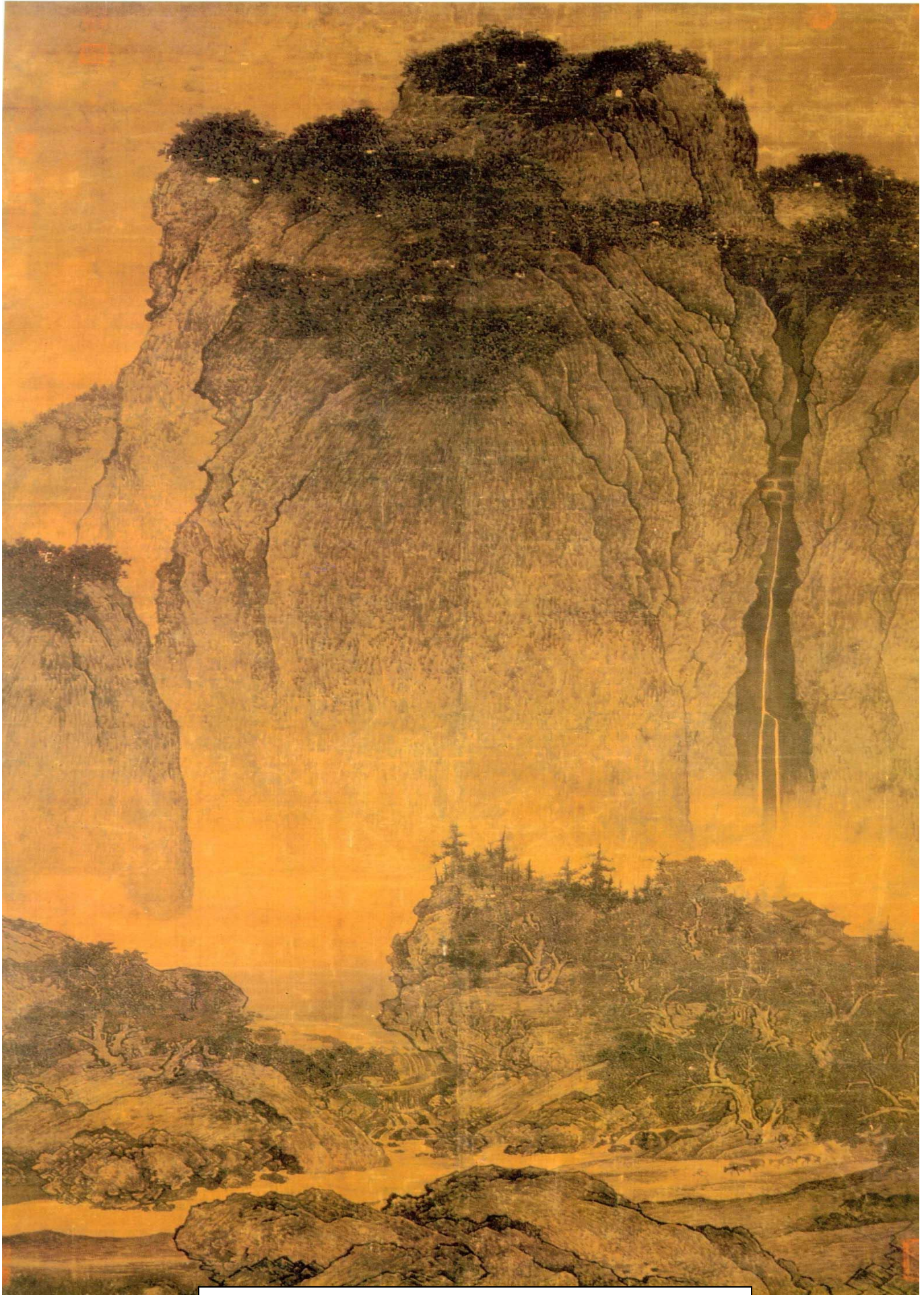
"Rejsende mellem bække og bjerge" af Fan Kuan (990-1030)